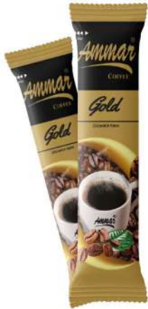
AMMAR COFFEE GOLD 2 GR