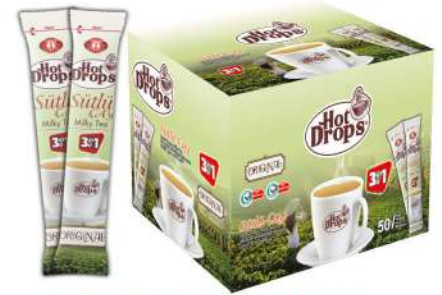
HOT DROPS 5in1 BALLI ZENCEFİLLİ 18 GR