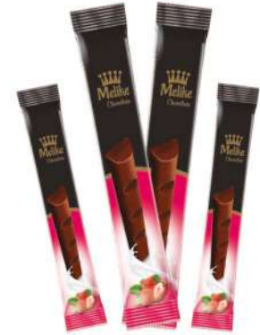
MELIKE CHOCOLATE WITH STRAWBERRY 28 GR