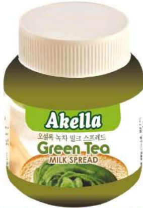
AKELLA GREEN TEEA SPREAD 350 GR