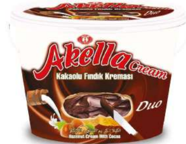
AKELLA SPREAD CREAM CHOCOLATE DUO 800 GR