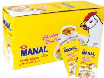
MANAL CHICKEN BOUILLON 10 GR