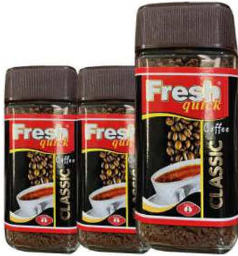
FRESH QUICK COFFEE CLASSIC 50 GR