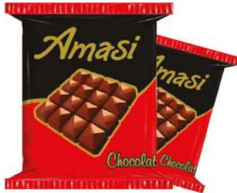
AMASI CHOCOLATE 50 GR