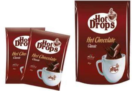
HOT DROPS HOT CHOCOLATE 20 GR