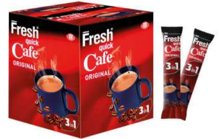
FRESH QUICK CAFE ORIGINAL 3in1 18 GR