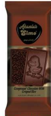
SIMO CHOCOLATE WITH DUCLING FIGURE 60 GR