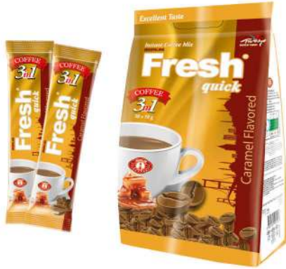
FRESH QUICK COFFEE 3 in 1 WITH CARAMEL 18 GR

SICAK İÇECEKLER / HOT DRINKS / مشروبات ساخنة BOISSONS CHAUDES / Горячие напитки