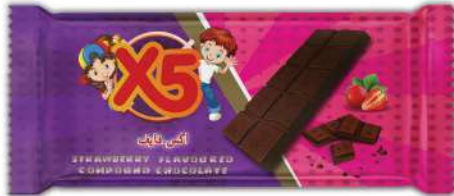
X5 STRAWBERRY FLAVOURED COMPOUND CHOCOLATE 25 GR