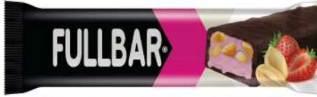
COCOA COATED STRAWBERRY FLAVOUR INNER WITH PEANUT COCOLIN