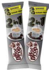
HOT DROPS 2in1 5 GR