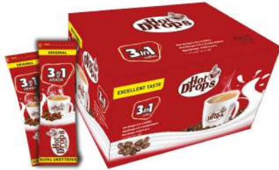
HOT DROPS COFFEE 3 in 1 ORIGINAL 10 GR