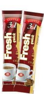
FRESH QUICK COFFEE 3 in 1-18 GR