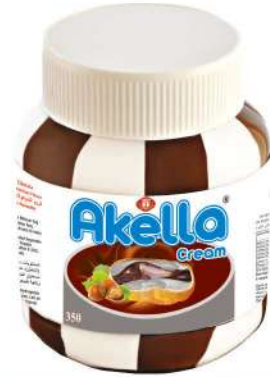
AKELLA SPREAD CREAM CHOCOLATE DUO 350 GR