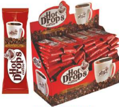
HOT DROPS COFFEE 2 GR

SICAK İÇECEKLER / HOT DRINKS / مشروبات ساخنة BOISSONS CHAUDES / Горячие напитки