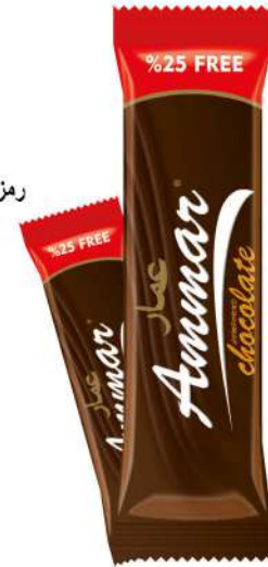
AMMAR COCOA TABLET CHOCOLATE