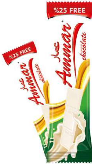
AMMAR MILKY TABLET CHOCOLATE

ÇİKOLATALAR / CHOCOLATES / شوكولاته CHOCOLATS / шоколад