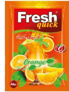
FRESH QUICK POWDER 45 GR / ORANGE