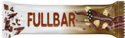
COCOA COATED BITTER FILLED WITH HAZELNUT PARTICULATE COCOLIN 60 GR