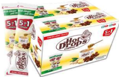
HOT DROPS 5in1 BALLI ZENCEFİLLİ 18 GR