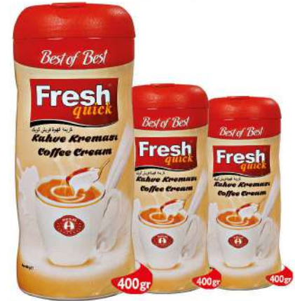
FRESH QUICK COFFEE CREAM 400 GR