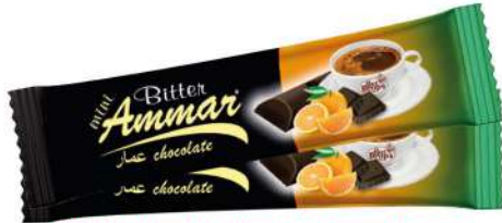
AMMAR ORANGE FLAVOURED BITTER CHOCOLATE 7 GR