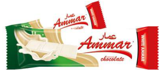
AMMAR TABLET MILKY CHOCOLATE 38 GR