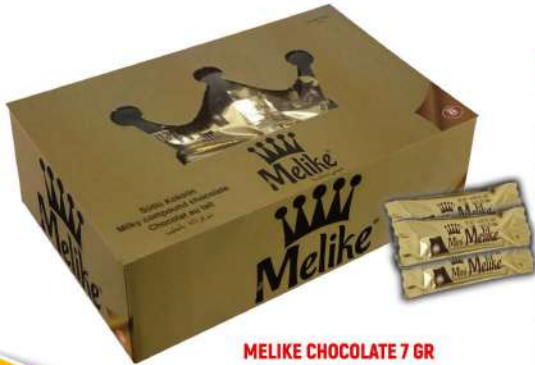
MELIKE CHOCOLATE 7 GR