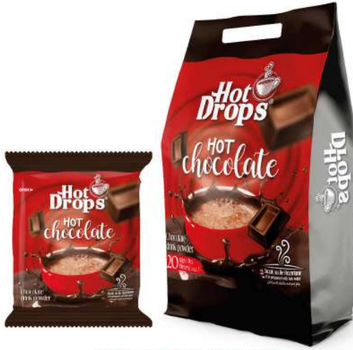
HOT DROPS HOT CHOCOLATE 20 GR

SICAK İÇECEKLER / HOT DRINKS / مشروبات ساخنة BOISSONS CHAUDES / Горячие напитки