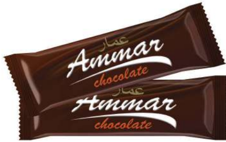
AMMAR TABLET CHOCOLATE 38 GR