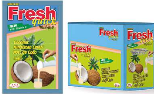
FRESH QUICK POWDER DRINK COCONUT 9 GR