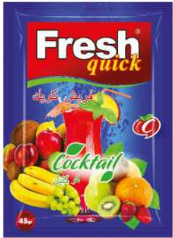
FRESH QUICK POWDER DRINK COCKTAIL 45 GR