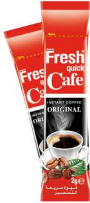
FRESH QUICK COFFEE CLASSIC 2 GR

SICAK İÇECEKLER / HOT DRINKS / مشروبات ساخنة BOISSONS CHAUDES / Горячие напитки