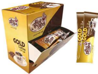
HOT DROPS COFFEE 2 GR