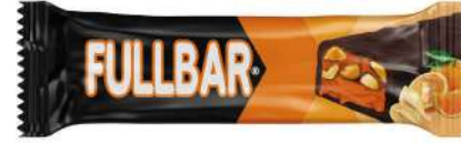
COCOA COATED ORANGE FLAVOUR INNER WITH PEANUT COCOLIN 60 GR