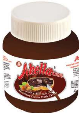
AKELLA SPREAD CREAM CHOCOLATE 350 GR