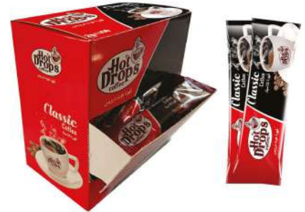
HOT DROPS COFFEE CLASSIC 2GR