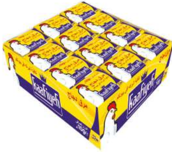
KAAFIYEH CUP CHICKEN BULYON 10 GR

SOSLAR / SAUCES / LA SAUCES صلاصة / COYC