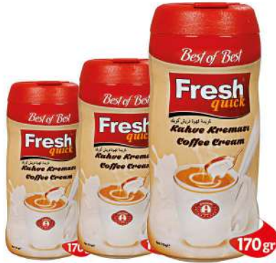
FRESH QUICK COFFEE CREAM 170 GR