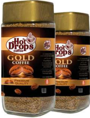
HOT DROPS GOLD CAFE 100 GR

SICAK İÇECEKLER / HOT DRINKS / مشروبات ساخنة BOISSONS CHAUDES / Горячие напитки