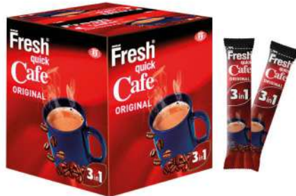
FRESH QUICK CAFE ORIGINAL 3in1 18 GR