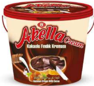
AKELLA SPREAD CREAM CHOCOLATE 400 GR