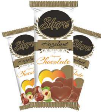
SHARE CHOCOLATE 77 GR