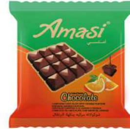
AMASI COMPOUND CHOCOLATE WITH ORANGE FLAVOUR 50 GR