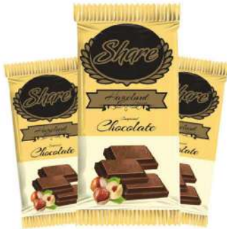
SHARE CHOCOLATE 50 GR