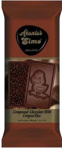
SIMO CHOCOLATE WITH DUCLING FIGURE 77 GR

ÇIKOLATALAR / CHOCOLATES / شوكولاته CHOCOLATS / шоколад