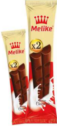
MELIKE X2 CHOCOLATE 50 GR