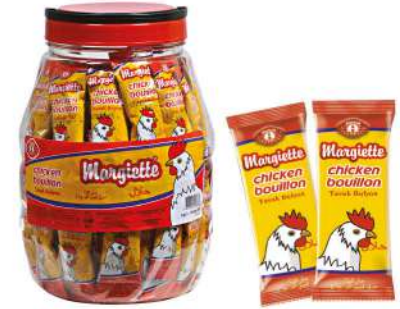
MARGIETTE POWDER CHICKEN BULYON PLASTIC KAVANOZ