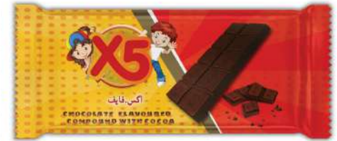
X5 CHOCOLATE FLAVOURED COMPOUND WITH COCOA 25 GR