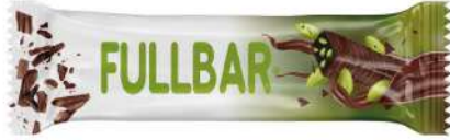
COCOA COATED BITTER FILLED WITH PISTACHIO PARTICULATE COCOLIN 60 GR