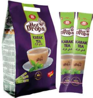
HOT DROPS KARAK TEA 20 GR

SICAK İÇECEKLER / HOT DRINKS / مشروبات ساخنة BOISSONS CHAUDES / Горячие напитки