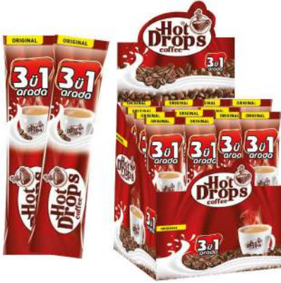
HOT DROPS COFFEE 3 in 1 ORIGINAL 18 GR

SICAK İÇECEKLER / HOT DRINKS / مشروبات ساخنة BOISSONS CHAUDES / Горячие напитки