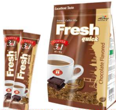
FRESH QUICK COFFEE 3 in 1 WITH CHOCOLATE 18 GR