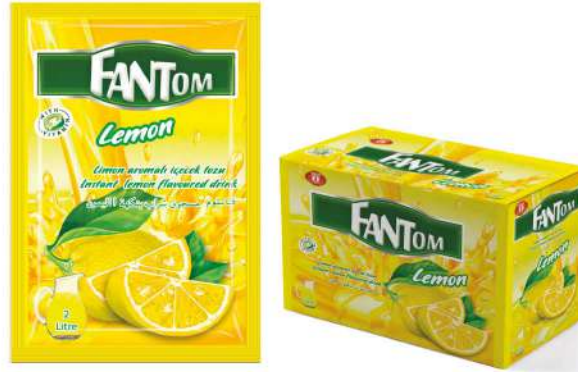
FANTOM POWDER DRINK LEMON 9 GR