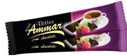
AMMAR RASPBERRY FLAVOURED BITTER CHOCOLATE 7 GR