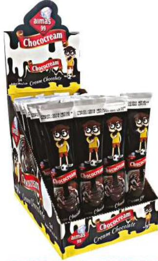
ALMAS 99 SPREAD TUBE CHOCOLATE 30 GR

ÇİKOLATALAR / CHOCOLATES / شوكولاته CHOCOLATS / шоколад