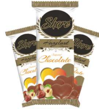
SHARE CHOCOLATE 60 GR