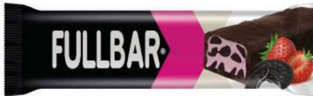
COCOA COATED STRAWBERRY FLAVOUR INNER FILLED BISCUIT COCOLIN