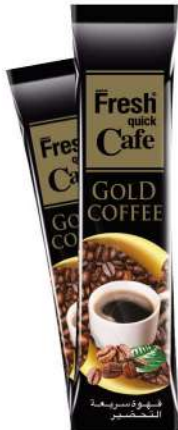
FRESH QUICK COFFEE GOLD 2 GR