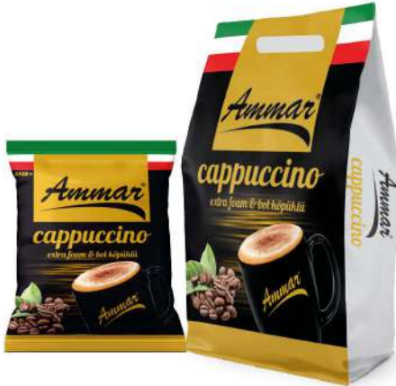
AMMAR GRANULE CAPPUCCINO 25 GR

SICAK İÇECEKLER / HOT DRINKS / مشروبات ساخنة BOISSONS CHAUDES / Горячие напитки