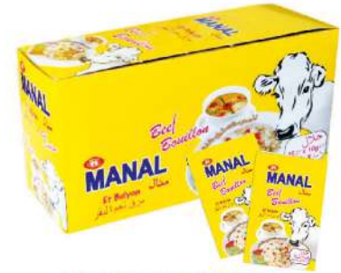
MANAL MEAT BOUILLON 10 GR