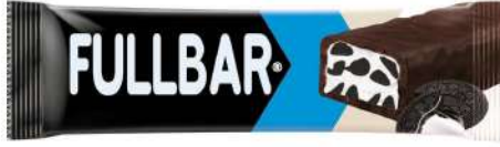
FULLBAR CREAM-FILLED COCOA BISCOIT-PARTICLE CHOCOLATE