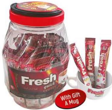
FRESH QUICK 3 in 1 COFFEE 18 GR IN JAR