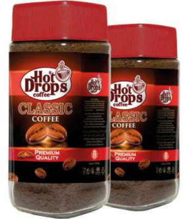
HOT DROPS CLASSIC CAFE 100 GR