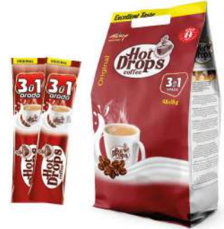
HOT DROPS COFFEE 3 in 1 ORIGINAL 18 GR