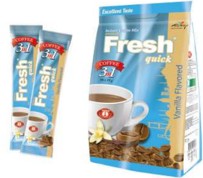
FRESH QUICK COFFEE 3 in 1 WITH VANILLA 18 GR