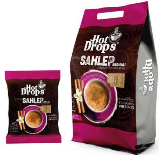
HOT DROPS SAHLEP 20 GR