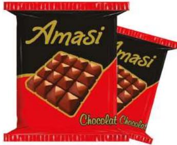
AMASI CHOCOLATE 67 GR

ÇİKOLATALAR / CHOCOLATES / شركة لانه CHOCOLATS / шоколад