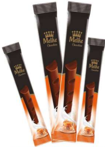
MELIKE CHOCOLATE WITH CARAMEL 28 GR