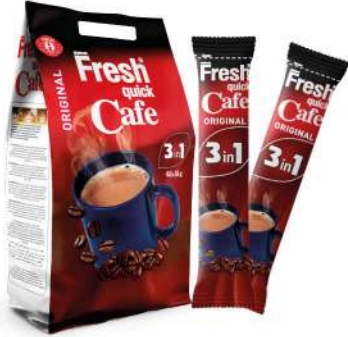
FRESH QUICK CAFE ORIGINAL 3in1 18 GR

مشروبات ساخنة / HOT DRINKS / SICAK İÇECEKLER / BOISSONS CHAUDES / Горячие напитки