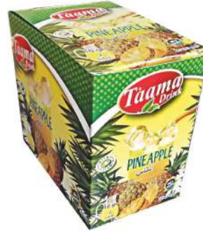
TAAMA POWDER DRINK PINEAPPLE 10 GR