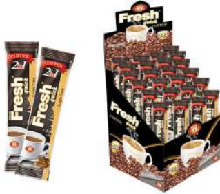
FRESH QUICK COFFEE 2 in 1-12 GR

مشروبات ساخنة / SIKAK İÇECEKLER / HOT DRINKS / BOISSONS CHAUDES / Горячие напитки