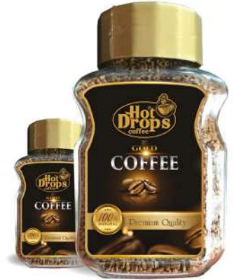
FRESH QUICK COFFEE GOLD JAR COFFEE 200 GR