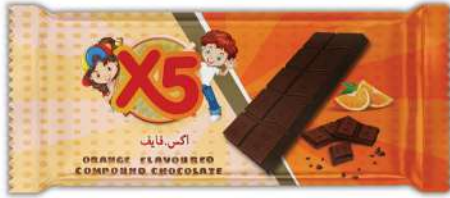
X5 ORANGE FLAVOURED COMPOUND CHOCOLATE 25 GR