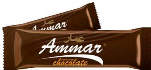
AMMAR TABLET CHOCOLATE 50 GR