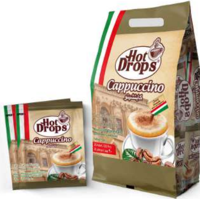
HOT DROPS GRANULE CAPPUCCINO 25 GR