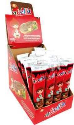
AKELLA SPREAD TUBE CHOCOLATE 15 GR