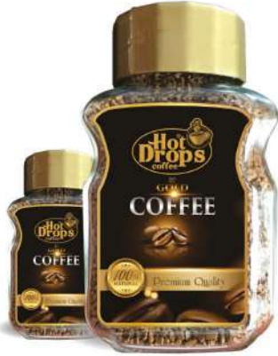
FRESH QUICK COFFEE GOLD JAR COFFEE 100 GR