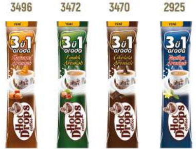
HOT DROPS COFFEE 3 in 1 WITH 18 GR