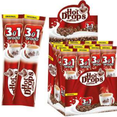
HOT DROPS COFFEE 3 in 1 ORIGINAL 18 GR

SICAK İÇECEKLER / HOT DRINKS / مشروبات ساخنة BOISSONS CHAUDES / Горячие напитки