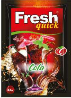
FRESH QUICK POWDER DRINK COLA 45 GR