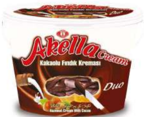
AKELLA SPREAD CREAM CHOCOLATE DUO 400 GR