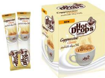
HOT DROPS CAPPUCCINO 15 GR