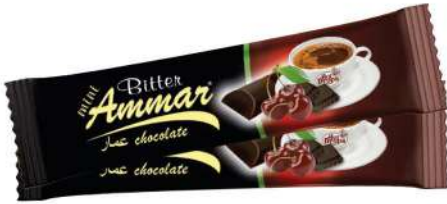
AMMAR CHERRY FLAVOURED BITTER CHOCOLATE 7 GR