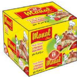
MANAL CHICKEN BOUILLON