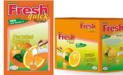
FRESH QUICK POWDER DRINK ORANGE 9 GR