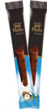
MELIKE CHOCOLATE WITH COCONUT 28 GR